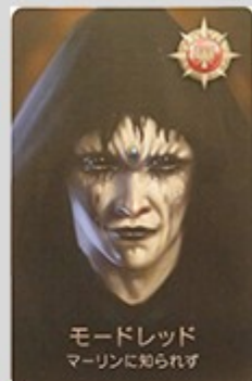
モードレッド マーリンに知られず